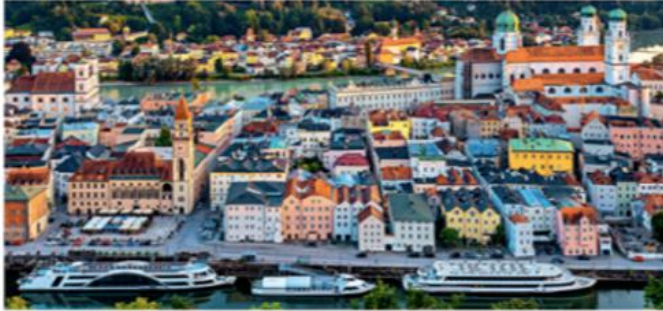
Das ist Passau: Panorama mit Altstadt und Schiffen

Studium und Freizeit. Lies den Magazintext und beantworte die Fragen.